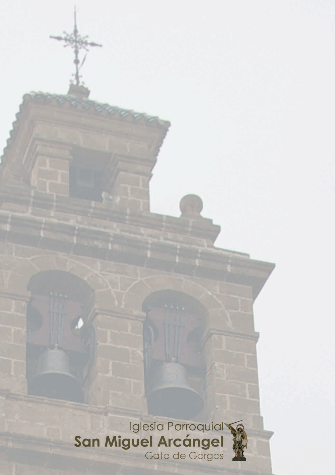
Iglesia Parroquial San Miguel Arcángel Gata de Gorgos